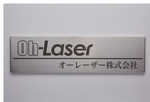
■アイデア次第で様々な素材をカット