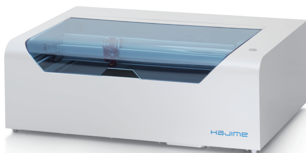
レーザー加工機 HAJIME 標準価格 ¥598,000 + 税