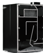
集塵脱臭機も低価格でご用意。 ¥60,000 + 税